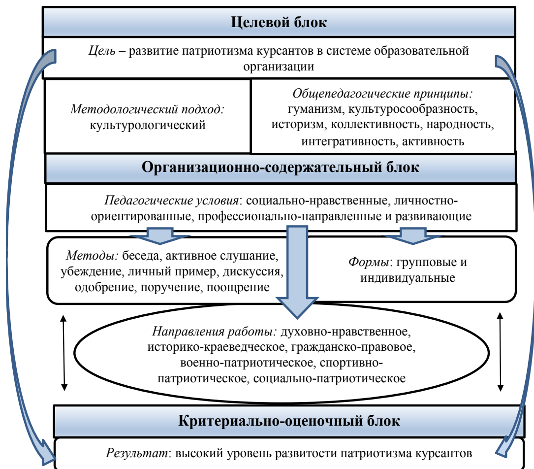
Рис. 2. Педагогическая модель развития патриотизма курсантов образовательных организаций ФСИН России

Педагогическое обеспечение процесса патриотического воспитания курсантов образовательных организаций ФСИН России ориентировано на выполнение сложных функций будущего офицера (воспитательные и административные) и ценностей профессиональной деятельности в целом. Патриотизм выступает как результат патриотического воспитания и является интегративным качеством личности курсанта, которое