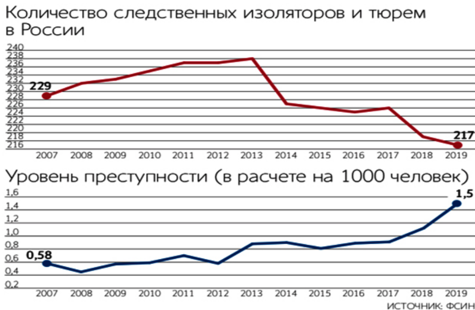
Рис. 2. Сравнение количества следственных изоляторов и тюрем в России с уровнем преступности в расчете на 100 тыс. чел.