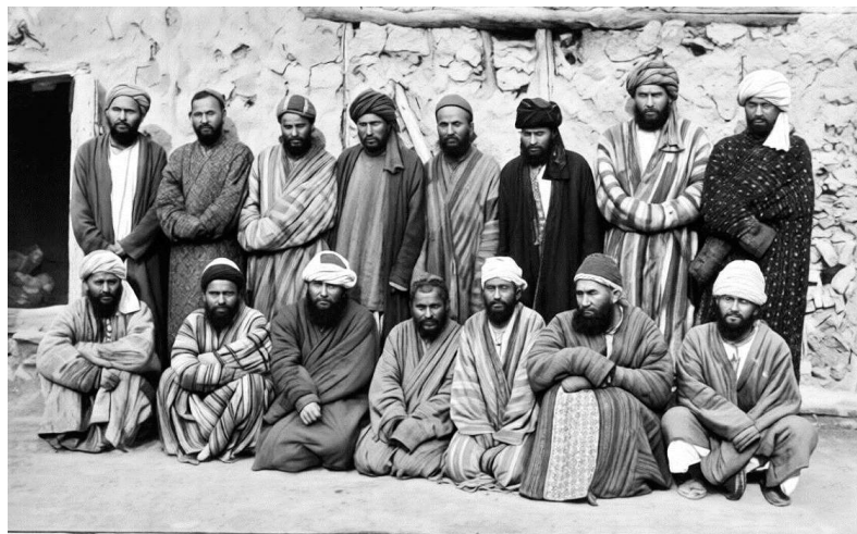
PRISONERS OF BUCHARA

Рис. 3. Группа заключенных в Бухаре, 1899 г. 1