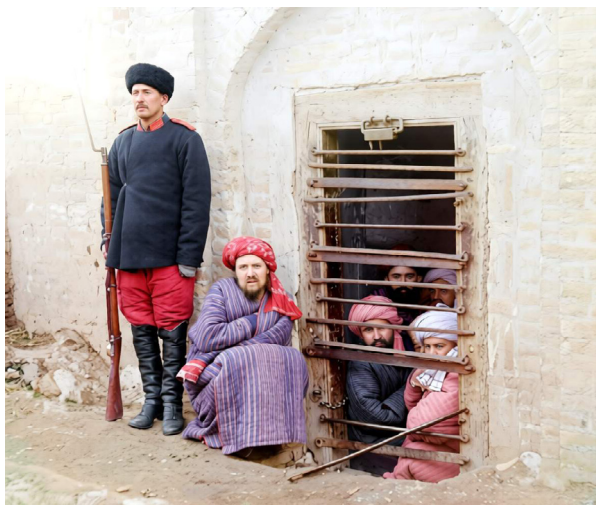
Рис. 2. Охрана заключенных в зиндане 1

Ко времени присоединения к России Средней Азии на ее территории существовало три мусульманских ханства – Бухарское, Кокандское и Хивинское, которые регулярно конфликтовали между собой. В организации внутреннего управления они были схожи с административно-полицейской системой соседних мусульманских стран. В итоге сложилась специфическая среднеазиатская модель управления. Наиболее ярким примером организации полицейской и уголовно-исполнительной деятельности того времени был Бухарский эмират. Согласно описаниям академика В. В. Бартольда, там «во главе полиции был курбаши, которому были подчинены сорок четыре миршаба; из них четверо, имевшие под своим начальством каждый десять миршабов, назывались сотниками (юзбаши)» [2, с. 366].