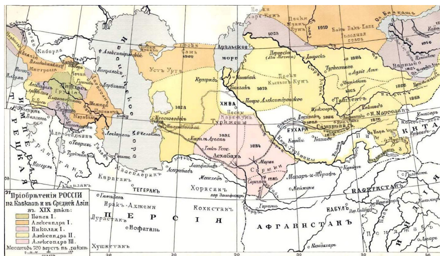
Рис. 1. Присоединение к России территорий Средней Азии в XIX в. 1

оставались за местными полицейскими руководителями, которые в большинстве своем имели воинские чины.