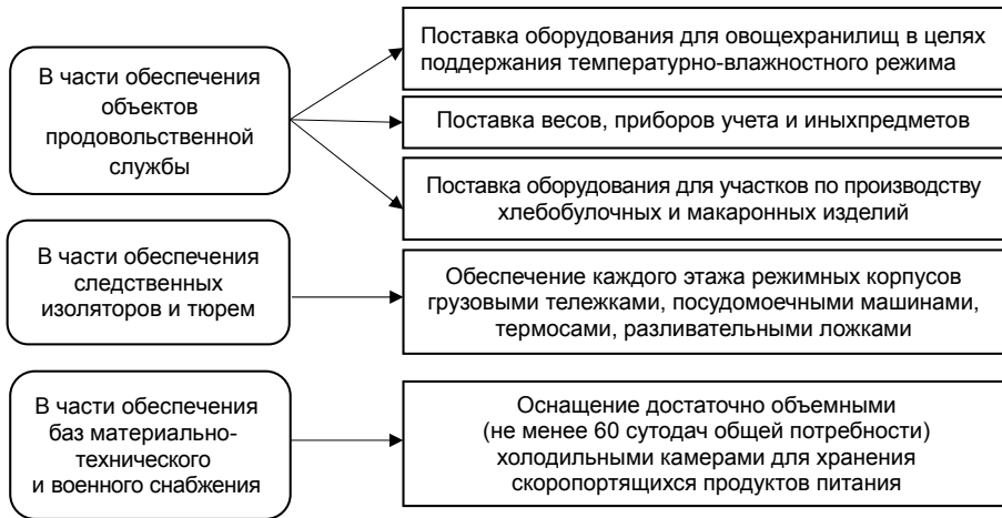
Рис. 1. Примеры материально-технического обеспечения