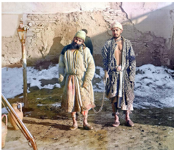
Рис. 4. Скованные узники. Бухара 1

вал кирпичный завод и пр. Однако вместо прибыли эти начинания нередко приносили чистый убыток. Очевидно, что любые работы с участием криминального контингента могли быть успешными лишь в присутствии надежной охраны. В пенитенциарных учреждениях среднеазиатского региона это было слабое звено. В частности, приводится пример, когда «военный караул отказался исполнять требование начальника тюрьмы о заключении буйствующего арестанта в темный карцер, объяснив это следующими словами: «Как же мы можем войти в камеру, когда их там много, а нас мало, они у нас отберут винтовки»» [11, с. 206]. Вскрывались и случаи подкупа тюремных и полицейских чинов, в результате которых совершались побеги осужденных, либо неправомерное освобождение подсудимых.